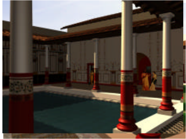
Fig 4 et 5 : Hypothèses de restitution du triclium

Il est à noter également que les nombreuses rencontres inter-disciplinaires (archéologues-architectes-infographistes) furent le lieu privilégié des réactions et nouveaux questionnements : les images en cours d'élaboration sont un facteur « déclencheur » indéniable pour l'archéologue. Il réagit sur la nature et l'aspect des matériaux, la conformation des éléments architecturaux, les proportions ou encore les procédés constructifs qui sont de facto mieux cernés, la visualisation tridimensionnelle met en évidence des points habituellement laissés dans l'ombre. C'est principalement pour cette raison que la phase de reconstitution proprement dite est plus porteuse d'avancées dans la connaissance archéologique du bâtiment ou du site que les résultats visuels qui en sont tirés.