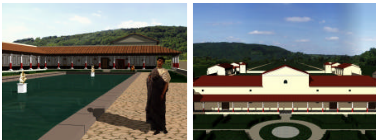
Fig. 10 et 11 : la villa et ses dépendances dans son site.

Pour les images détaillées en extérieur, la villa virtuelle devant être incrustée dans son site réel, une prise de vue photographique à 360° et retravaillée pour y faire disparaître tout élément contemporain (ainsi que tous les arbres résineux absents au premier siècle) à été élaborée (Fig. 10 et 11)