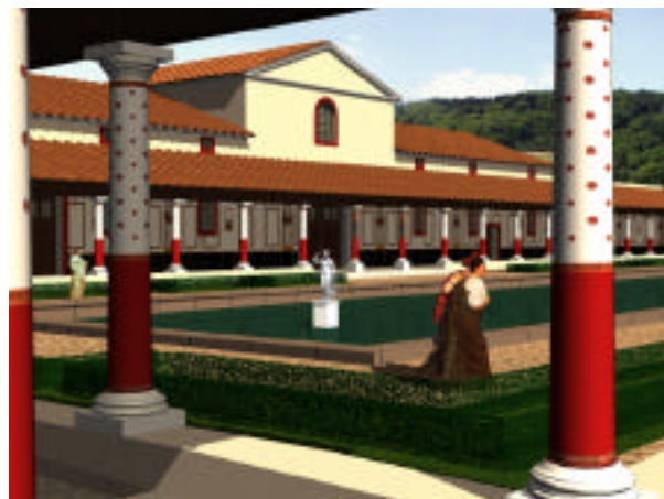
Fig. 6 et 7 : Façade sur cour et façade « arrière » du bâtiment central.

Une première série d'images montrant les différents corps de bâtiments et la manière avec laquelle il composent l'édifice d'origine a été produite (Fig. 6 et 7), se poursuivant avec l'adjonction de bâtiments supplémentaires lors de la deuxième période de construction au début du 2 e siècle. Certaines de ces images ont été calculées depuis un point de vue virtuel identique à celui d'un observateur situé devant le panneau sur lequel est imprimée l'image, lui permettant d'imaginer la volumétrie du bâtiment en fonction des restes devant lesquels il se trouve.