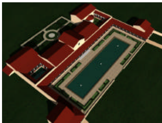
Fig. 1 : Vue aérienne de la villa

La partie centrale de la villa (118m x 62m) s'organise autour d'une salle d'apparat monumentale flanquée de pièces à vivre, chambres, cuisines, etc. De chaque côté de ce bâtiment principal se trouvent deux cours à péristyle menant pour l'une à un très grand triclinium et pour l'autre à l'ensemble balnéaire (Fig. 1).